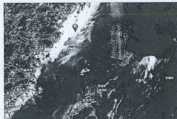
图1 浙江海岸线上的南麂列岛(B点)

南麂列岛位于浙江省平阳县东南海面,2011年5月起行政归属平阳县鳌江镇,上有11个行政村,设立南麂社区以管理,现有居民2400多人。陆域面积11.3平方公里,由52个大小岛屿组成。本岛