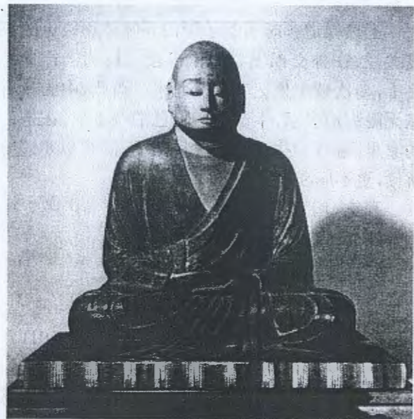
图4 圆珍坐像(园城寺藏、国宝)